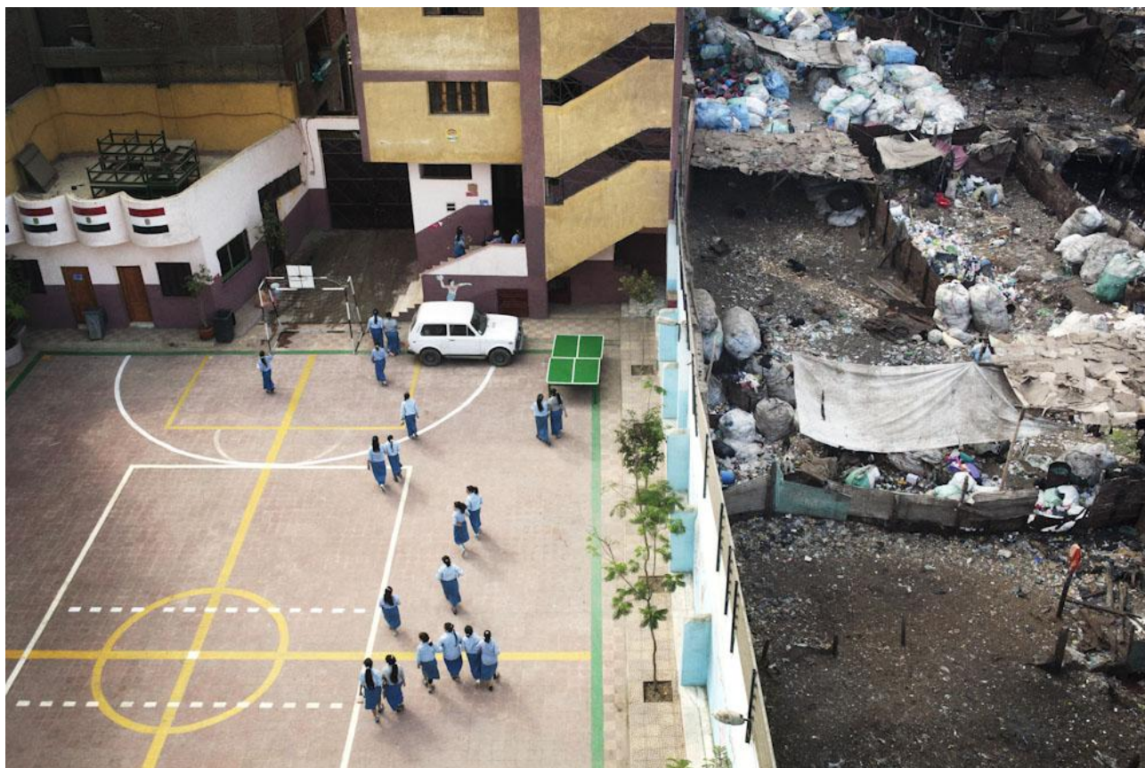
L'école Mahaba

Les enfants de Mahaba ont besoin de votre soutien ! Nous sommes à la recherche de nouveaux parrains.