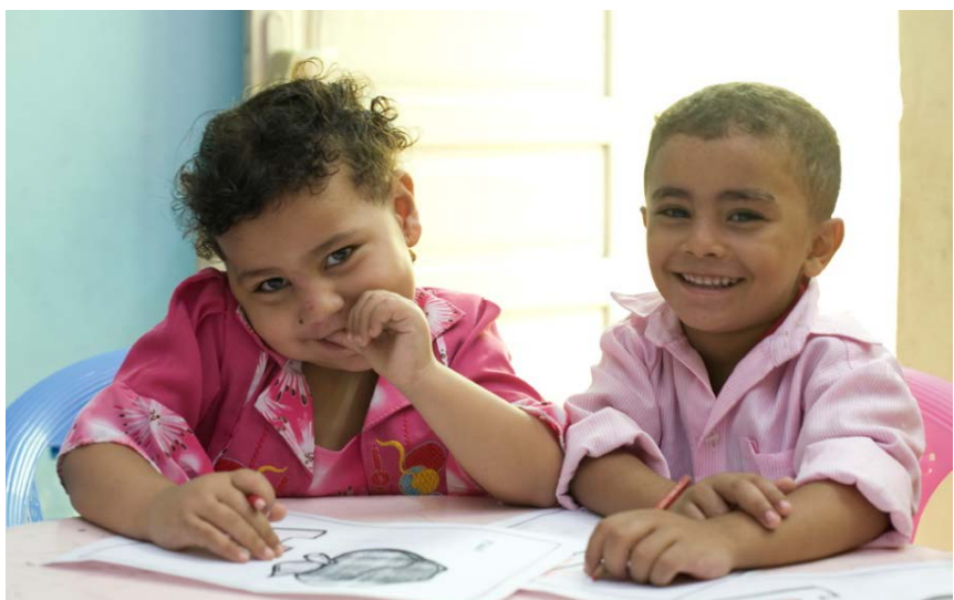
Enfants bénéficiaires AEDG - Egypte

L'AEDG a aussi mis en place des ateliers artistiques ainsi que des assemblées d'enfants permettant à 375 enfants de prendre la parole et de s'exprimer différemment. Ces temps de paroles ont instauré un environnement positif pour leur développement. Grâce à la participation active des enfants, ces activités ont abouti à la réalisation d'un film et d'un livre interactif. Ces outils témoignent des impacts du projet sur les enfants et sont de véritables supports pour sensibiliser aux Droits de l'Enfant.