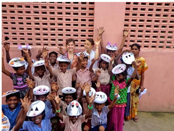
Animation avec les enfants en Inde

Témoignage de Sandra partie à Madagascar avec notre partenaire Orchidées Blanches