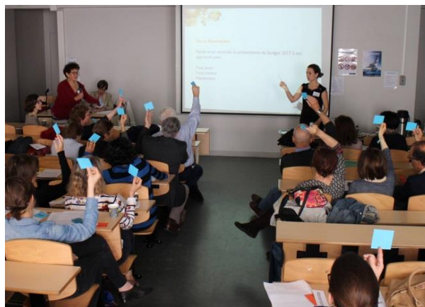
Des adhérents lors de l'Assemblée Générale 2017

Pour plus d'informations, contacter Antoinette Pichon au 01 70 32 02 50 ou par mail apichon@asmae.fr