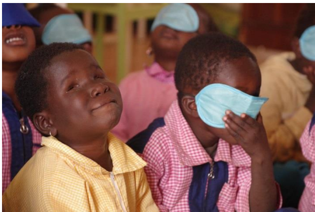
L'éducation inclusive permet aux enfants malvoyants, aveugles et non aveugles d'apprendre et de grandir ensemble.

Enfin, l'UN-ABPAM a vu ses compétences renforcées en matière de gestions opérationnelle, administrative et financière, et ce grâce à l'accompagnement quotidien de l'équipe Asmae au Burkina Faso.