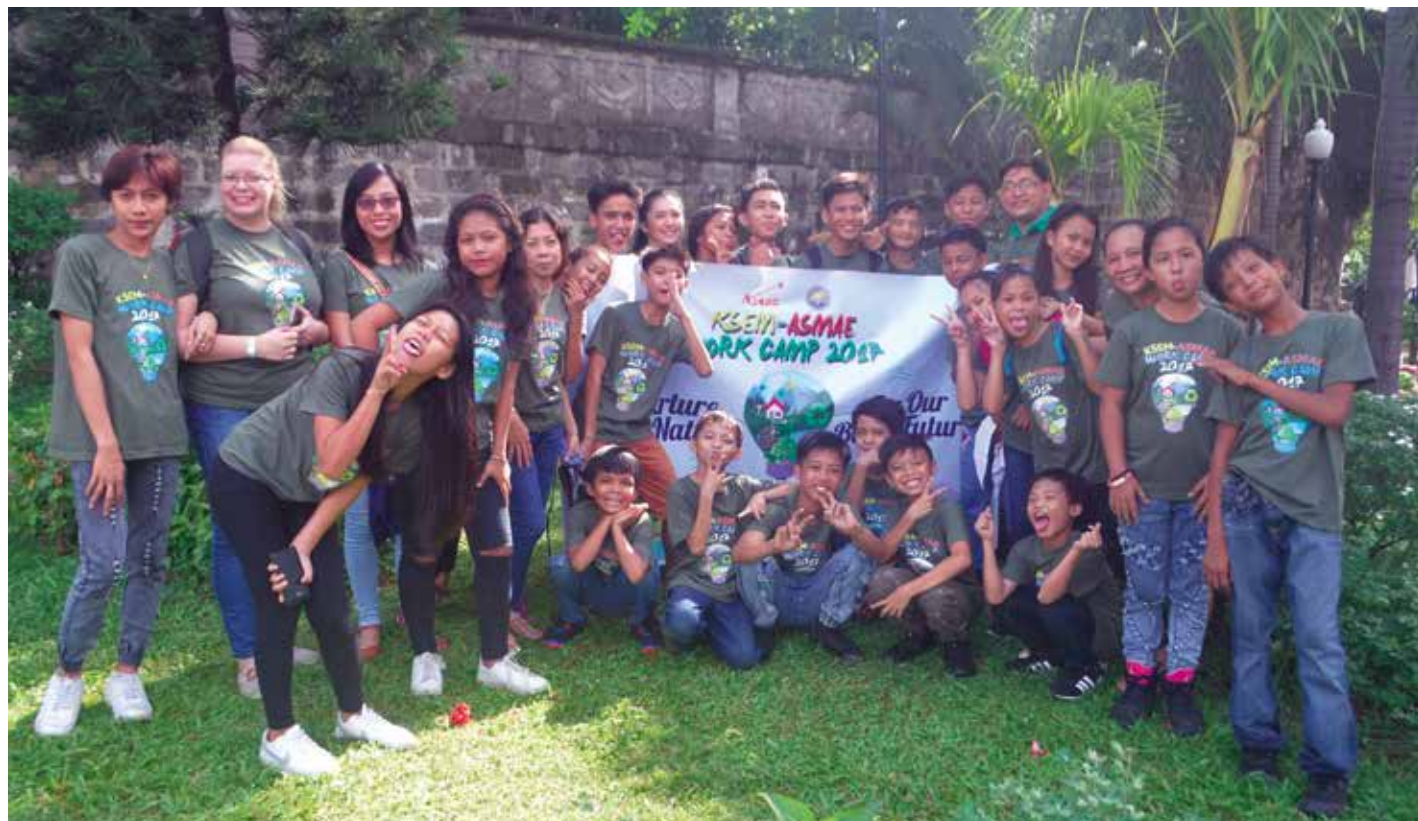
Des enfants bénéficiaires du chantier de solidarité internationale en 2017 animé par une bénévole mandatée par Asmae.