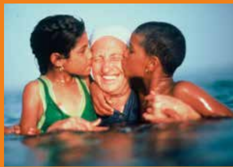
Sœur Emmanuelle avec deux petits chiffonniers dans le canal de Suez (Égypte)

Depuis 38 ans, Asmae poursuit l'action de sa fondatrice, dans le respect de ses principes.