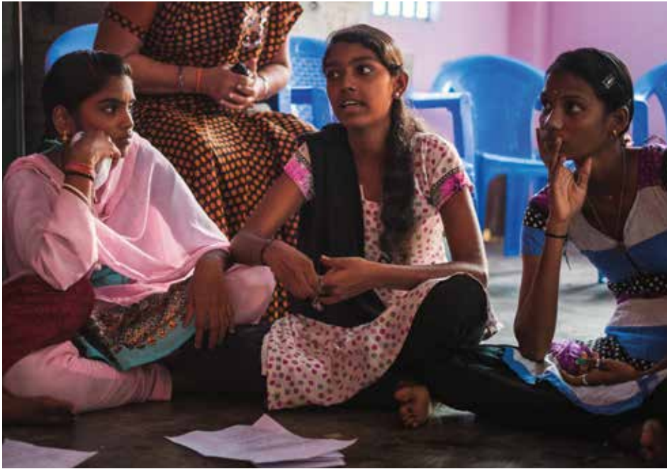
Asmae et Arunodhaya, partenaire situé à Chennai dans le Tamil Nadu, sensibilisent les jeunes à leurs droits. Dès que ces jeunes sont formés, ils participent aussi activement à la promotion de leurs droits.