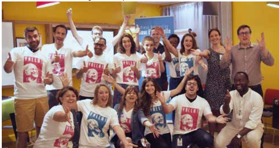
Atelier de sensibilisation chez Google France en juin 2019

« SENSIBILISER LES JEUNES À LEURS DROITS, C'EST AUSSI LES RENDRE PLUS CITOYENS. »