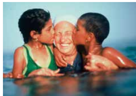
Sœur Emmanuelle avec deux petits chiffonniers dans le canal de Suez (Égypte)

Notre objectif pour les années à venir est de rationaliser nos moyens afin d'allouer une part toujours plus importante à la mission sociale.