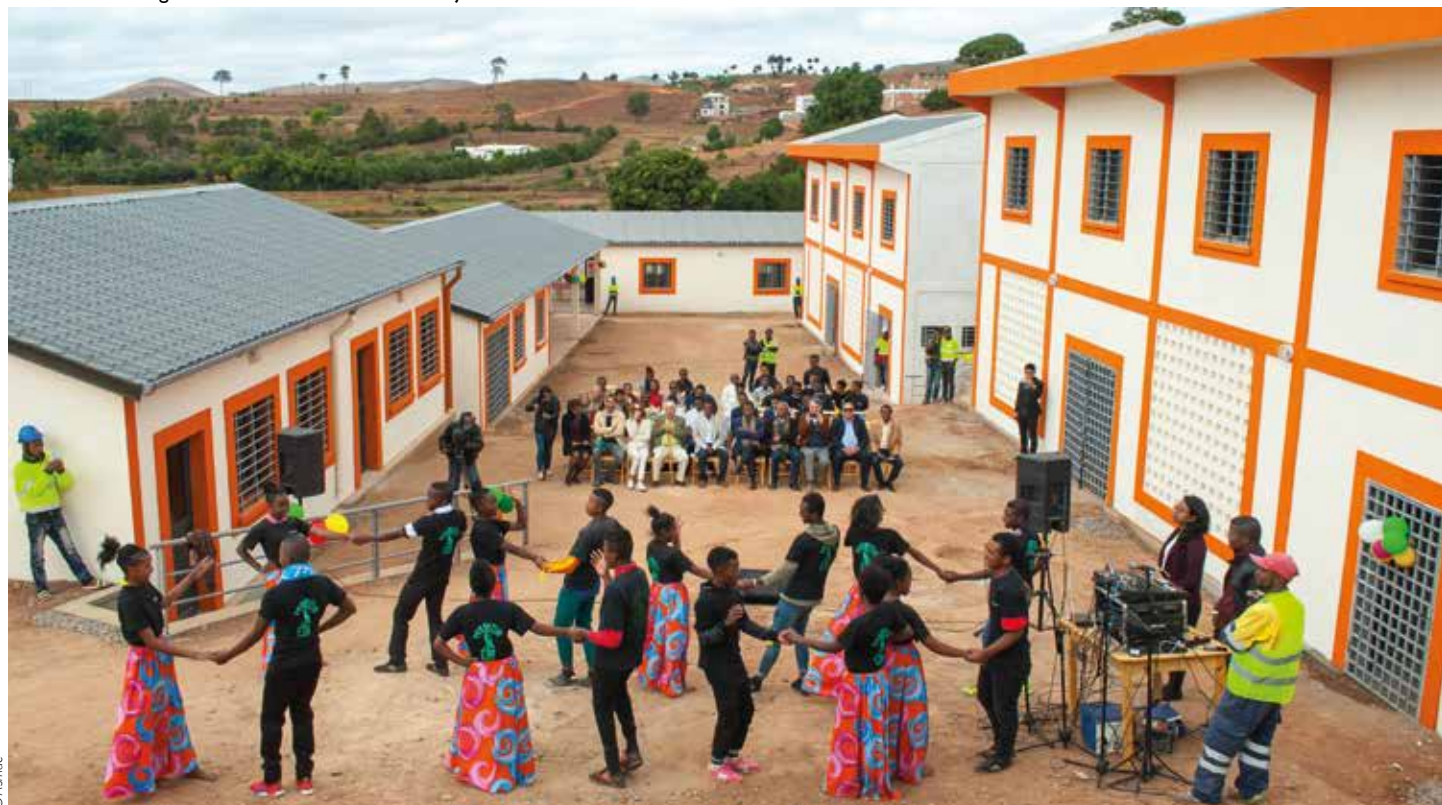
Cérémonie d'inauguration des bâtiments au mois de juillet 2019.

1 Exclusion scolaire et moyens d'inclusion au cycle primaire à Madagascar, Unicef, 2012