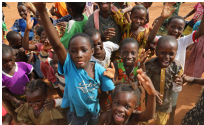
Enfants participants au programme PEACE en Côte d'Ivoire.

Dans le nord de la Côte d'Ivoire, aux portes du Sahel, des milliers de familles fuient l'insécurité et la pauvreté. Comme toujours, les enfants paient le prix le plus fort : violences, ruptures familiales, mariages forcés, exclusion. Face à cette situation, Asmae agit pour leur offrir un espace sûr où grandir, apprendre et se reconstruire.